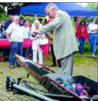
Der Mühlheimer Yachtclub, der Kanu-Klub und der Ruderverein luden am vergangenen Samstag gemeinsam zum 1. Mühlheimer Mainfest ein, um den Wassersport einem größeren Publikum zu präsentieren. Von jedem Verein wurde jeweils ein Boot getauft. Danach konnten die zahlreichen Besucher Fahrten mit Ruderbooten, Segelyachten, Kanus und Kajaks unternehmen.